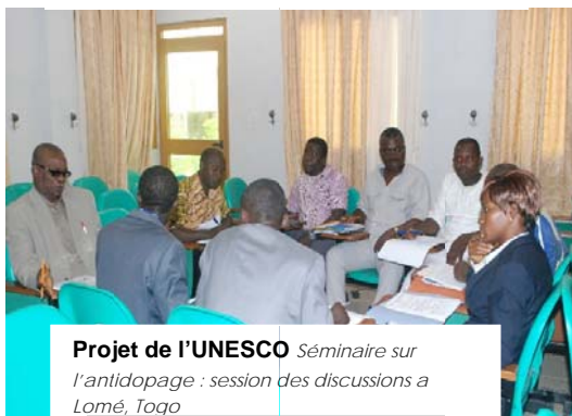
Projet de l'UNESCO Séminaire sur l'antidopage : session des discussions à Lomé, Togo

La Guinée-Bissau, la Mauritanie, Sao Tomé-et-Principe, la Sierra Leone, le Soudan du Sud et la Tanzanie n'ont pas encore ratifié la Convention