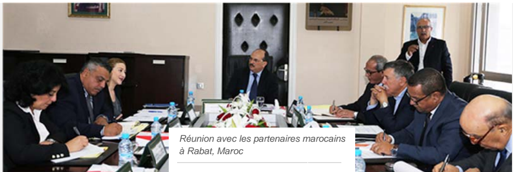
Réunion avec les partenaires marocains à Rabat, Maroc

Depuis leur création, les organisations antidopage régionales (ORAD) jouent un rôle essentiel pour atteindre des secteurs non pris en compte jusqu'à maintenant par les programmes antidopage. Quarante-huit pays africains appartiennent à l'une des six ORAD en Afrique. La viabilité de ces organisations dépend de la coopération des CNO et des gouvernements, qui fournissent des ressources, des conseils, du leadership, etc.