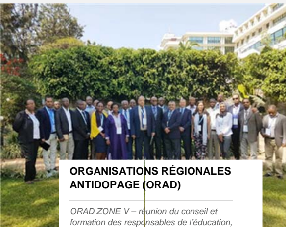
ORGANISATIONS RÉGIONALES ANTIDOPAGE (ORAD)

L'ORAD reste ouverte et coopère avec toute entité faisant la promotion du sport propre afin de préserver les valeurs du sport et du franc jeu.