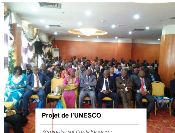
Projet de l'UNESCO

Voici le lien vers l'information sur la Conférence des Parties de l'UNESCO, y compris les formulaires d'inscription à