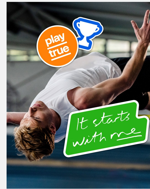
Visuel slogan (4:5)