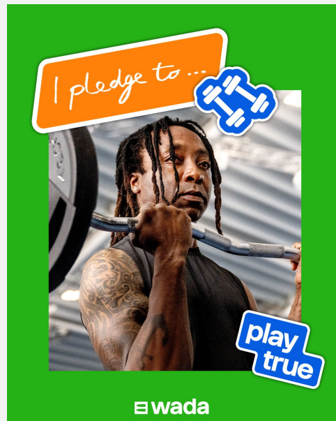
Visuel d'engagement (4:5)