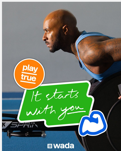
Visuel de lancement (4:5)